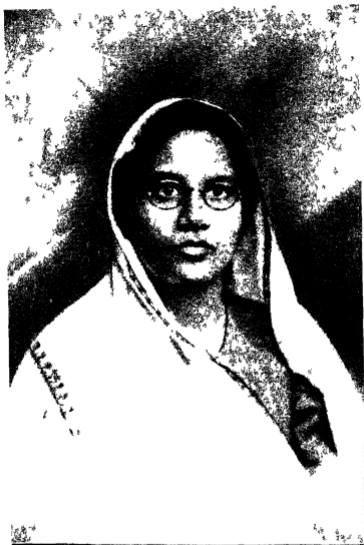
श्रीमती ५० ब्रजबालादेवीजी, झारा ।